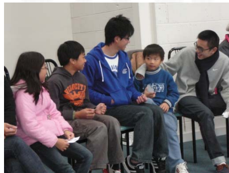
我們教會的「未來希望」