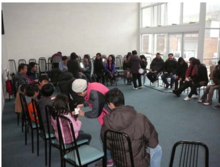
「排排坐，吃果果，貓兒擔凳姑婆坐」，好戲在後頭啊！」