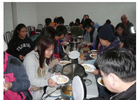
「嘩！唔好執輸！咁好味的食物！」