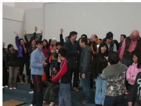
「贏左唔好咁開心，輸左都唔使喊！」