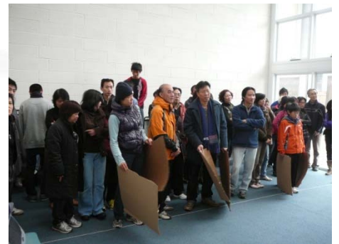
「On your mark」準備好未呀！